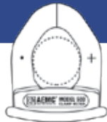
MODELO 503 Abertura de la pinza: 28 mm (1,1 pulg.) Tamaño del conductor: un cable de 500 kcmil

Medidores de pinza pequeños y compactos que caben en cualquier maletín de trabajo