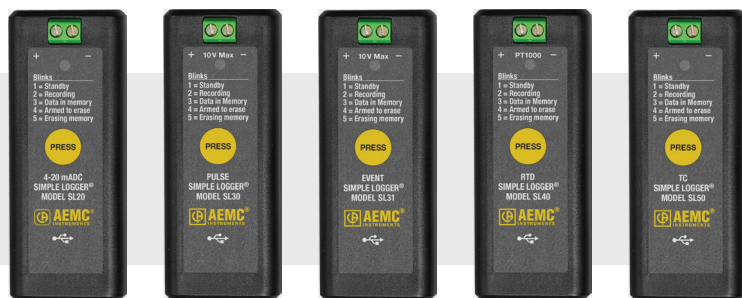
Modelo SL20 Modelo SL30 Modelo SL31 Modelo SL40 Modelo SL50

Modelos disponibles para el registro de corriente CC, temperatura, pulsos y eventos