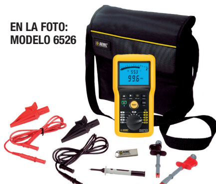
EN LA FOTO: MODELO 6526

Medidor, bolsa de transporte, dos cables de prueba de 1,5 m (5 pies) identificados por colores (rojo/negro), dos pinzas tipo cocodrilo identificados por colores (rojo/negro), una punta de prueba (negra), dos puntas de prueba con pinza retráctil identificadas por colores (rojo/negro), dos pesas de 2,27 kg (5 lb) con base de hule conductivo, dos adaptadores de 4 mm sin aislamiento, 6 baterías AA y manual de usuario.